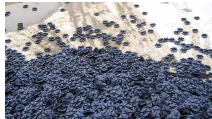
Può essere installata sia in vasche vuote che pieno vuoto (massima 5 mt)