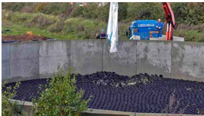
Big Bag: Consegna e installazione: