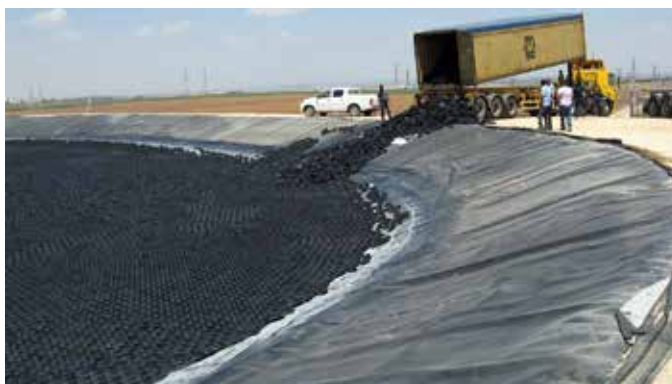
BULK: Consegna e installazione: