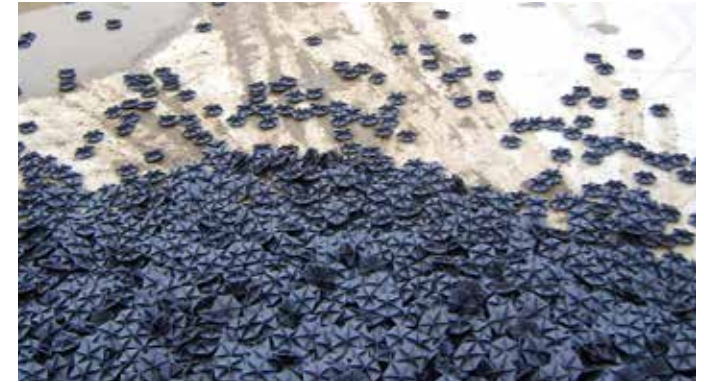
También instalación en tanque vacío (máx. 5 m de altura)