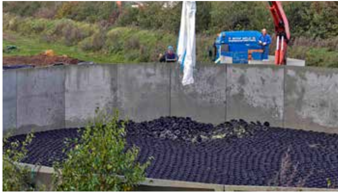
Big Bags: entrega e instalación