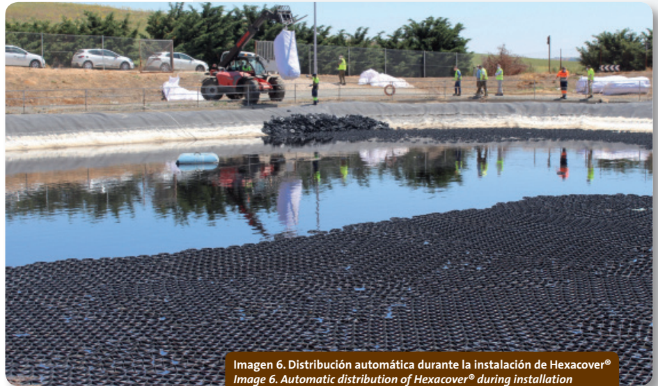
Imagen 6. Distribución automática durante la instalación de Hexacover® Image 6. Automatic distribution of Hexacover® during installation

The HexaCover® Floating Cover is an eco-friendly product manufactured using recycled plastic. It does not contain hazardous substances and is an ideal solution for the treatment of odours from leachate ponds.