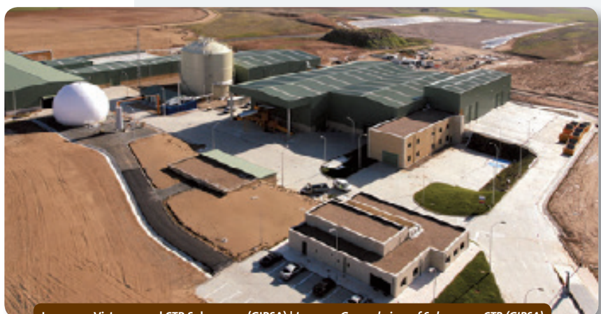
Imagen 1. Vista general CTR Salamanca (GIRSA) | Image 1. General view of Salamanca CTR (GIRSA)

The Salamanca CTR has a specific closed circuit for the collection and treatment of leachate produced at the facility in the biological processes, physical processes, rinsing,