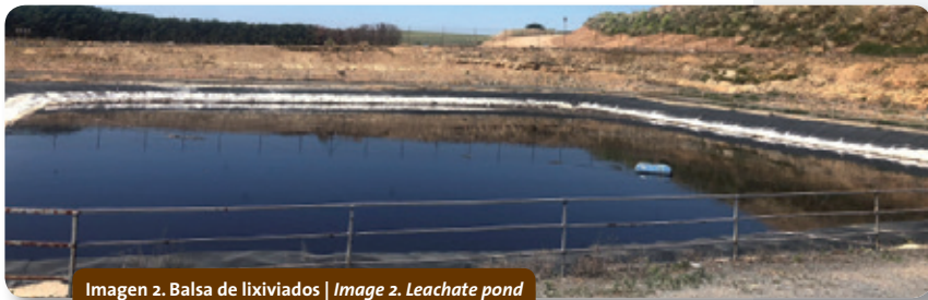
Imagen 2. Balsa de lixiviados | Image 2. Leachate pond