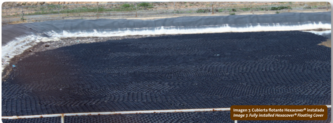
Imagen 7. Cubierta flotante Hexacover® instalada Image 7. Fully installed Hexacover® Floating Cover