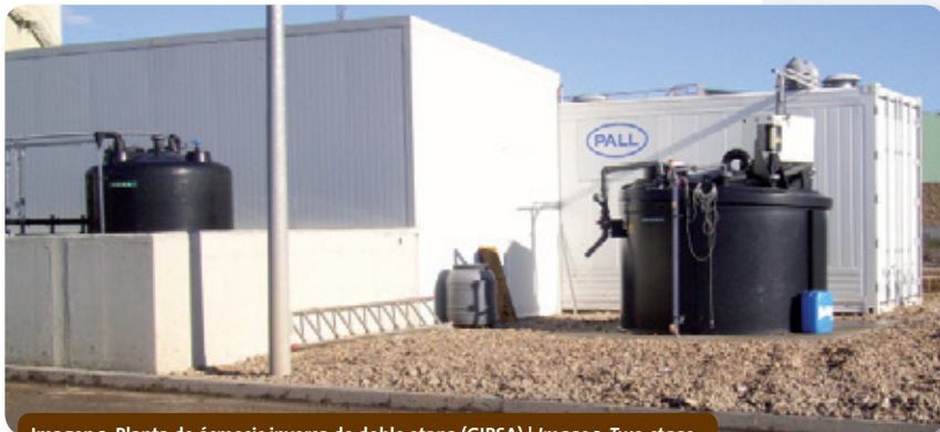
Imagen 3. Planta de ósmosis inversa de doble etapa (GIRSA) | Image 3. Two-stage reverse osmosis plant (GIRSA)

drainage, cleaning, etc. All these leachate streams, along with those generated in the landfill cells, flow into a pond of 4,455 m 3 , excavated on the grounds and waterproofed by means of a one-metre layer of compacted clay, bentonite, geotextile and a 2-mm layer of HDPE. The pond has a roughly quadrangular shape, with dimensions of 48.75 m x 45,70 m. It has a surface area of 2,280 m 2 .